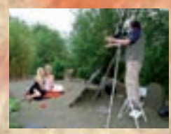
Frisuren, Make-up und Styling: Brigitte Wildangel und Team